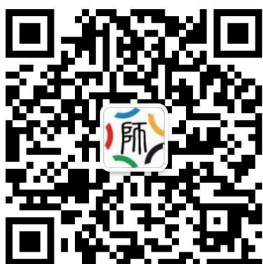
高校教师网络培训中心 微信公众号

学员可在微信中搜索【高校教师网络培训中心】或者扫描下图二维码关注网培中心公众号，进入点击下方【学习中心】按钮，选择【院校中心】，输入用户名密码即可登入所属院校教师在线学习中心，进行选课学习。